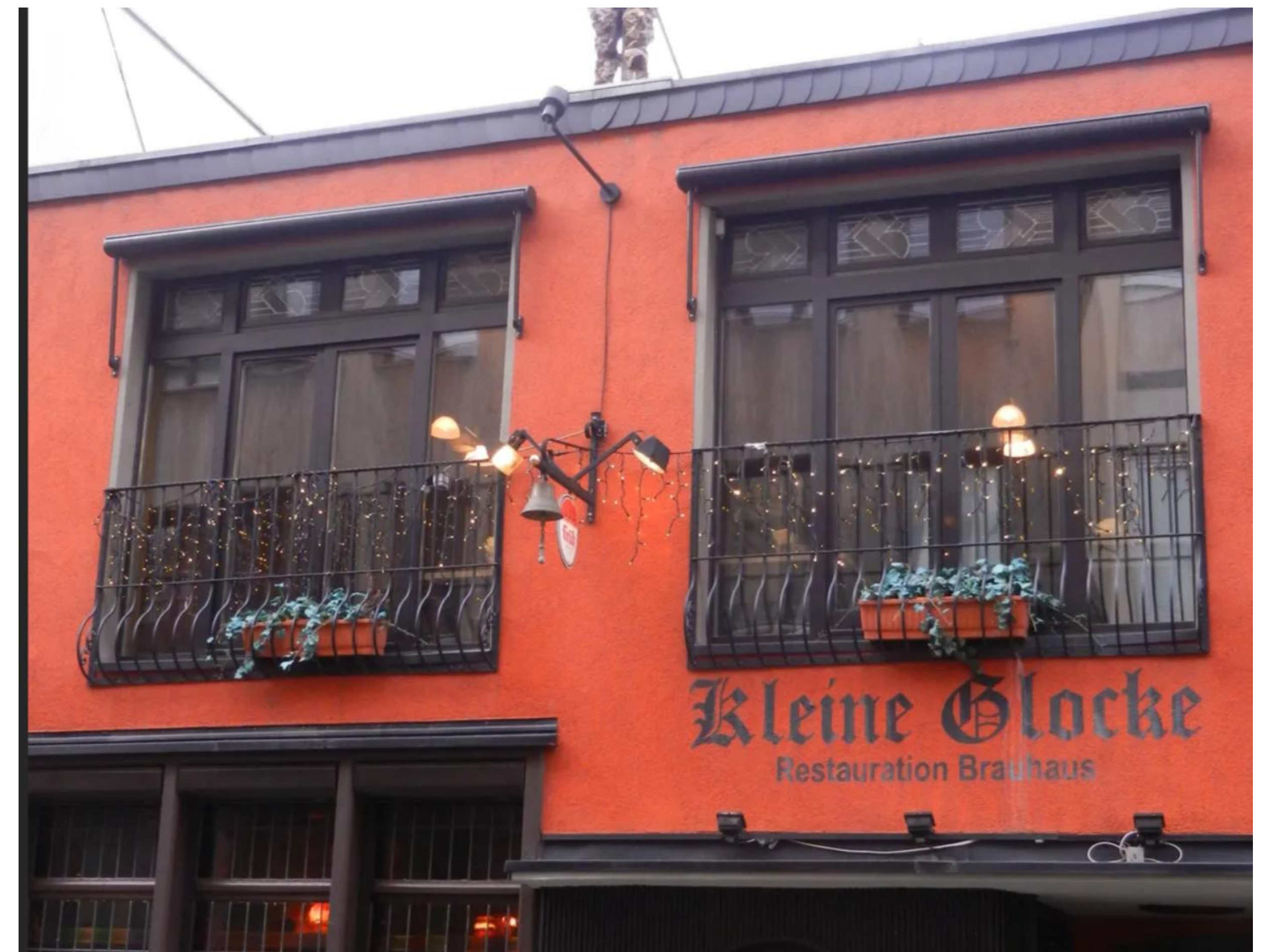
Künstlerkneipe "Kleine Glocke" in der Glockengasse Köln