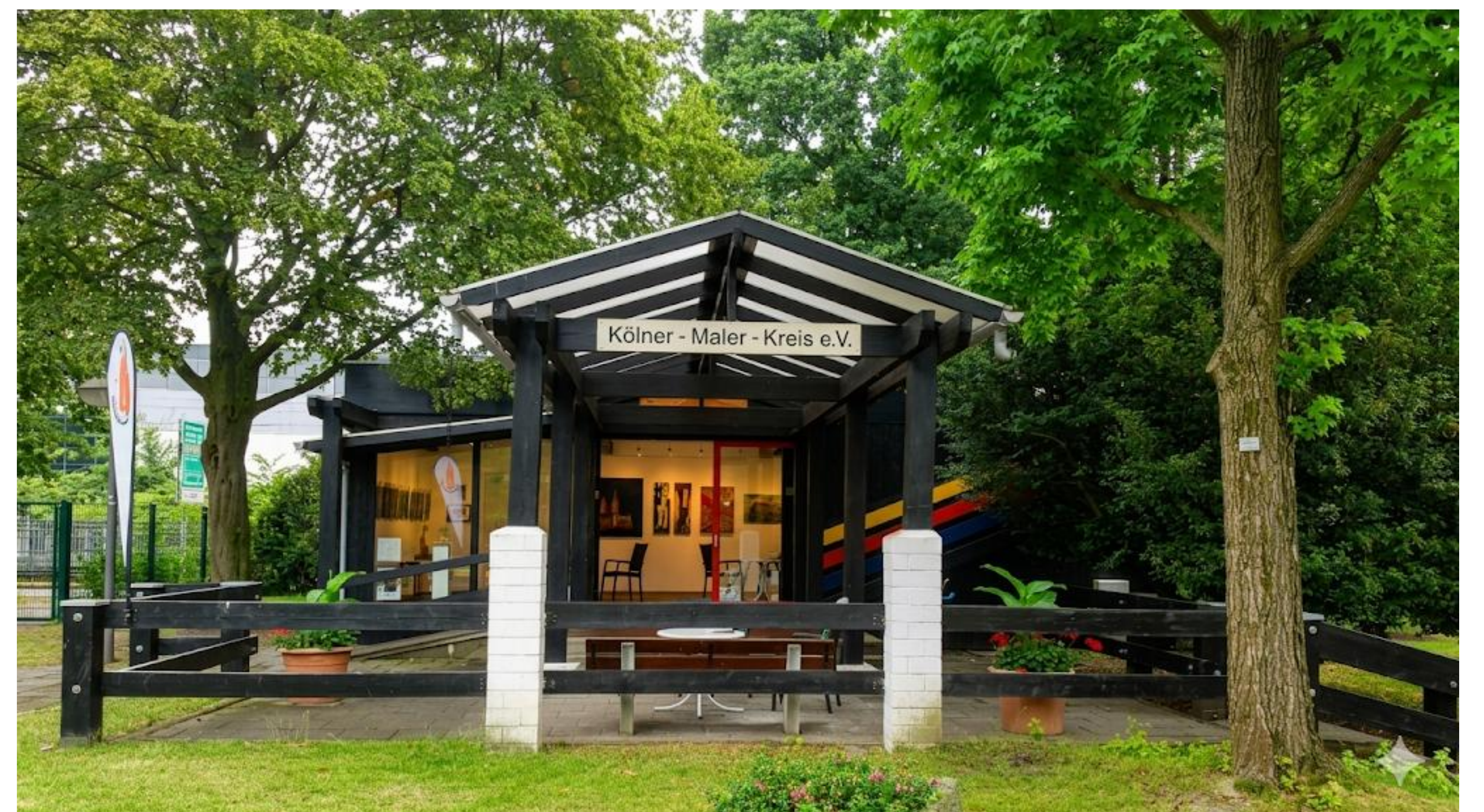
Unserer Galerie in neuem Glanz

Ein Meilenstein der Vereinsgeschichte folgte im Jahr 1986 : Der KMK mietete von der Stadt Köln das unter Denkmalschutz stehende „Floratorforhaus“ im Kölner Rheinpark – ein historisches Gebäude, das zur Bundesgartenschau 1971 als "Informationspavilion des Torfstreuverbandes" gedient hatte. In liebevoller Eigenleistung verwandelten die Mitglieder das Funktionsgebäude in eine charmante Kunstgalerie. Seit nunmehr 40 Jahren ist die Galerie „Im Malerwinkel“ ein beliebter Anlaufpunkt für Kunstinteressierte.